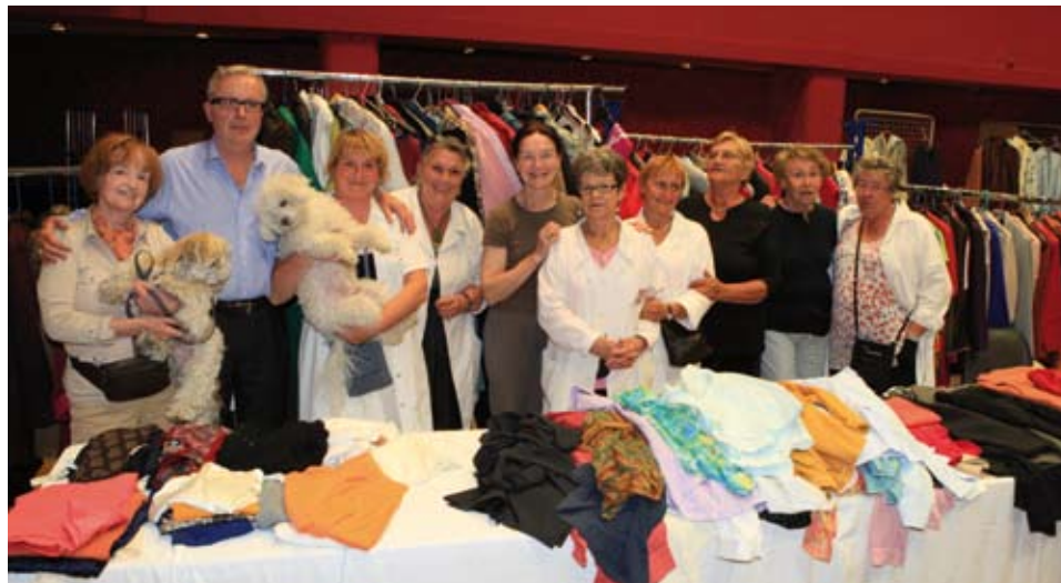
La braderie de la Croix Rouge

L'ADAPAF remplit sa mission d'aide aux personnes âgées et aux familles grâce à la subvention de 205 000 € donnée par la Ville et aux 19 000 heures de travail de ses 15 employés. Nos aînés bénéficient de la mutualisation des moyens humains et financiers du CCAS et de l'ADAPAF qui permet d'organiser le voyage annuel de 150 personnes, le goûter de Noël pour près de 400 personnes et d'offrir plus de 650 colis de Noël. Chaque année, le Foyer Jacques Letarouilly sert en moyenne près de 5 500 repas et près de 800 goûters gratuits. En faveur du maintien à domicile des personnes âgées, l'ADAPAF livre plus de 7 000 repas à domicile (préparés par le restaurant municipal), 150 personnes bénéficient du service d'aides ménagères et d'aide à la personne parfois en lien avec les Soins Infirmiers A Domicile (SIAD).