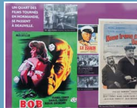
En 2012 : Deauville fête le Cinéma : toute une année dédiée au 7 ème art.