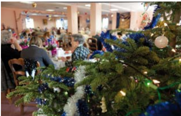
Déjeuner des aînés