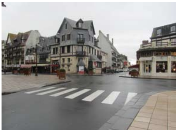
Travaux de sécurité réalisés carrefour Hoche