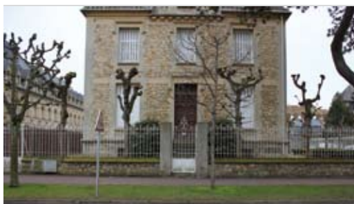
Le pavillon Saint Pierre, à côté des Franciscaines