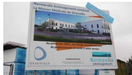
La maison médicale