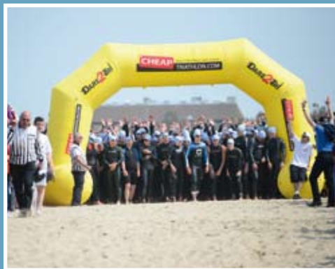
Le Triathlon est devenu en 2 ans le 7 ème de France avec 1700 participants.