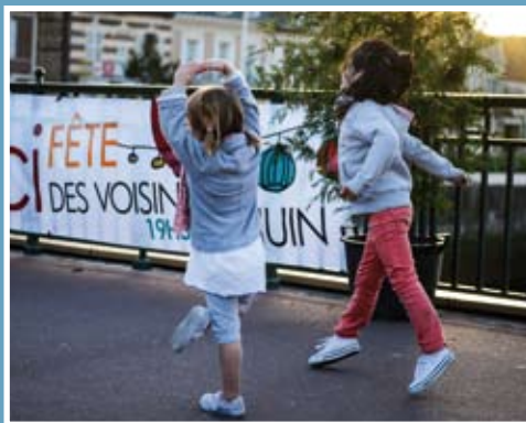
La fête des voisins.