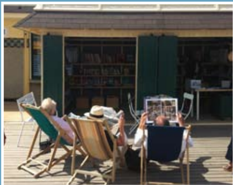
Une grande nouveauté 2013 : le kiosque « lire à la plage » qui a accueilli 4428 personnes cet été.