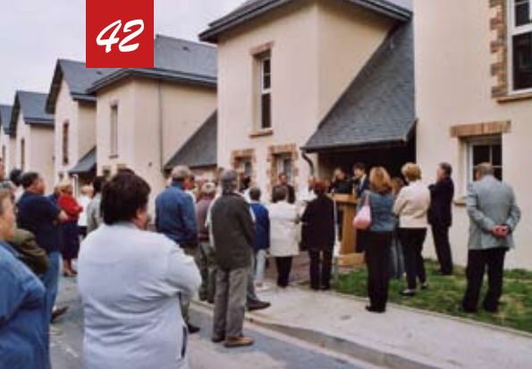
Inauguration des logements rue des Pavillons.