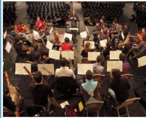
En 2013, Deauville fête la Création et propose toute l'année des expositions, des concerts, des ateliers- théâtre, de la danse, des ateliers photos pour les jeunes.