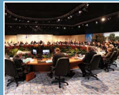
Le G27 des Ministres de la Défense de l'Union Européenne a précédé le G8 au C.I.D.