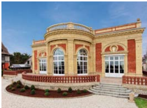
Villa Le Cercle