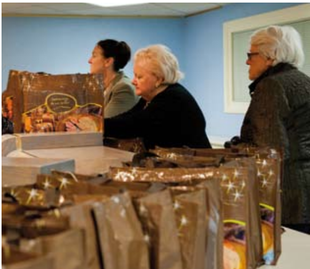
Remise des sacs-cadeaux de Noël