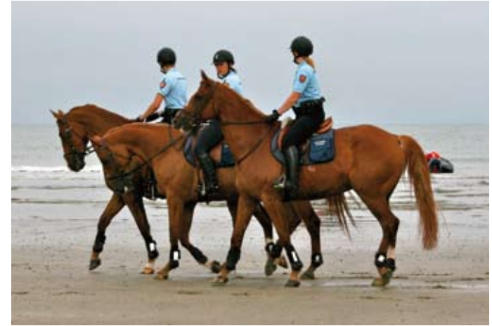
Deauville a aussi la "cheval attitude" de la gendarmerie montée.

Des agents municipaux à bicyclette : outre les policiers municipaux équipés déjà depuis plusieurs années, quatre vélos de service sont dédiés aux déplacements des élus et des agents.