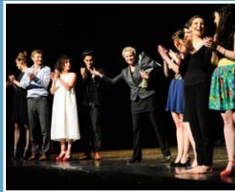
L'Amour en toutes lettres : un spectacle sur les correspondances amoureuses et les grands films d'amour (ici en 2013 avec l'Atelier des Déchargeurs).