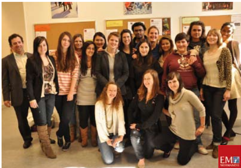
Une classe de l'Ecole de Management de Normandie dans les locaux ex-Fenetral réhabilités par la Ville