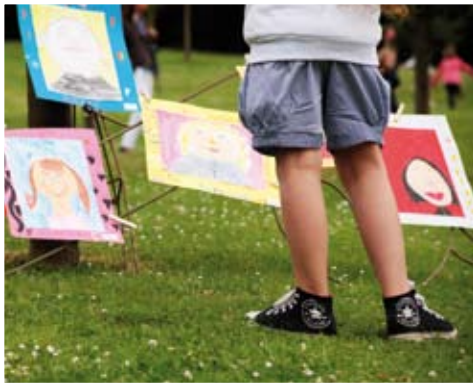
La Fête des Mères au Parc Gulbenkian.