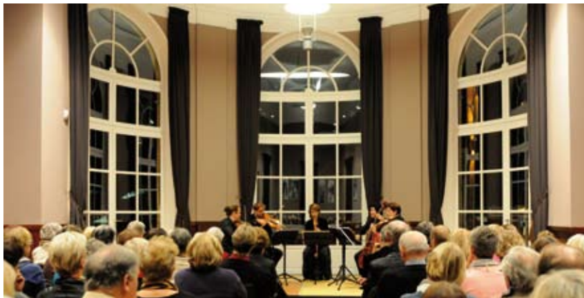
Rénovation de la Villa Le Cercle, qui accueille divers événements et notamment des concerts, des séminaires et des conférences.