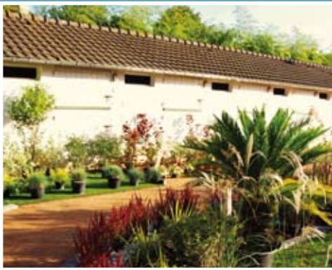
Passionnément Jardin : 2500 amateurs de belles plantations se sont retrouvés à l'automne dans les jardins de la Salle Elie-de-Brignac.