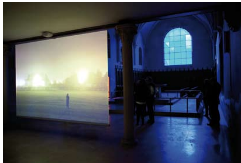
Vue intérieure des Franciscaines pendant l'exposition "Planche(s) Contact"