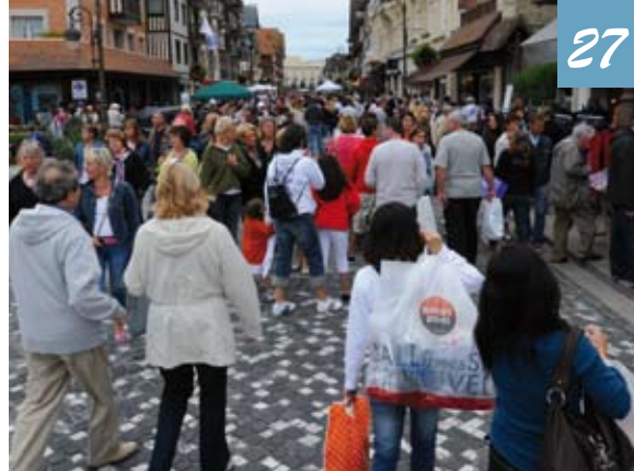
Festival des Soldes.

CréActive Place est un lieu unique où les idées émergent et les projets se décident. Avant son installation définitive sur la Presqu'île, CréActive Place est installé au C.I.D.