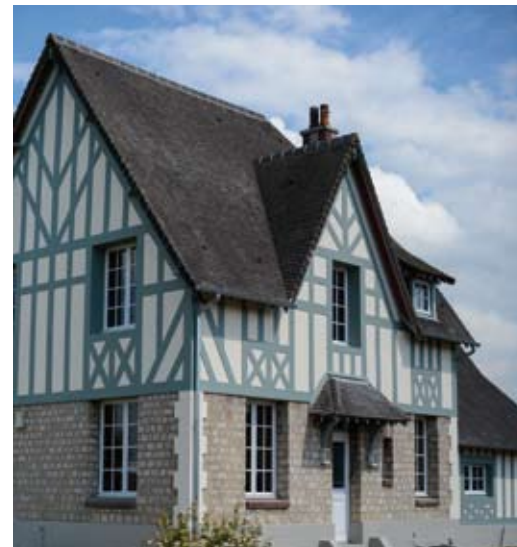
Villa Le Phare