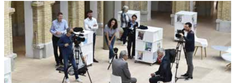
Image par image, article par article se construit la belle notoriété de Deauville.

Ville de tournages cinématographiques , elle a été le décor du film Sentimental Value , qui a remporté le Grand Prix au Festival de Cannes 2025,