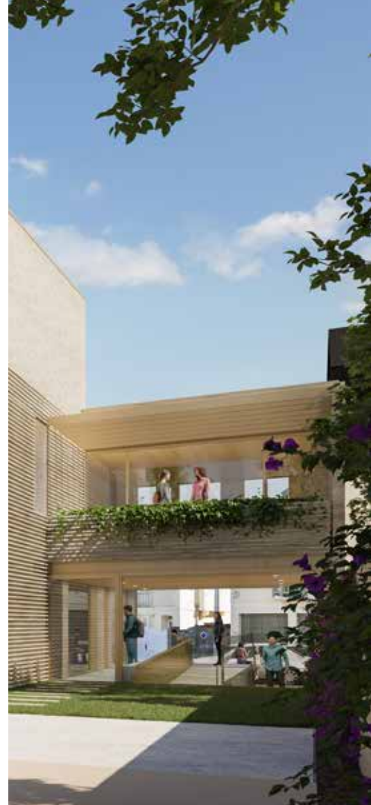
Photo de couverture Le futur Pôle social qui ouvrira au printemps 2026

Ce carnet de bord est financé par l'Association Deauville avec Passion